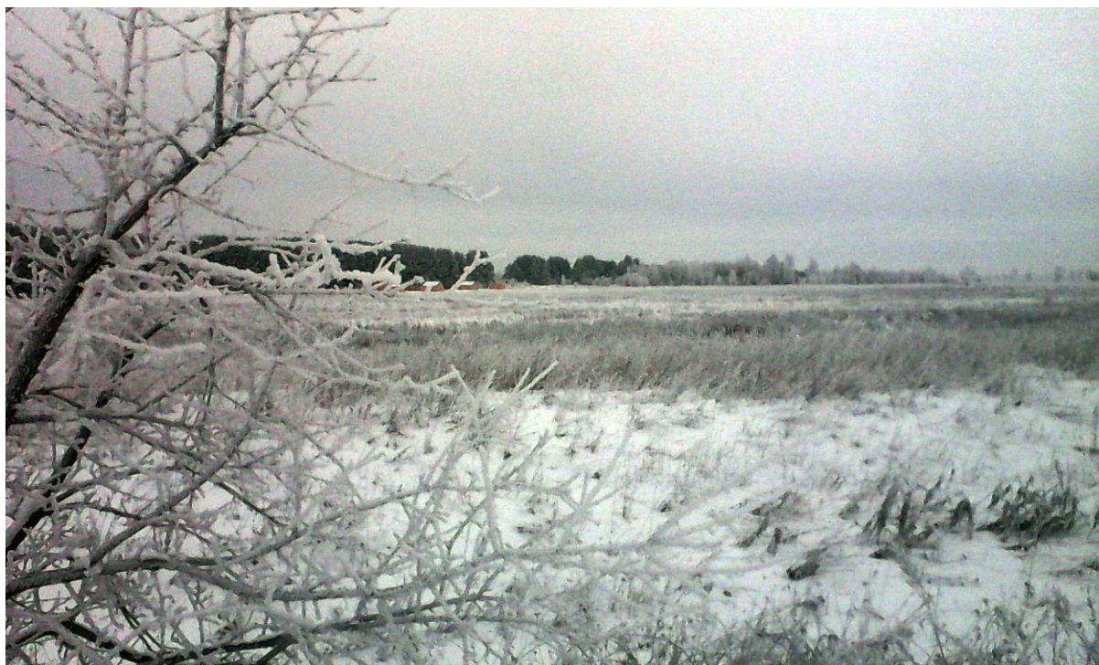
/Родные поля./