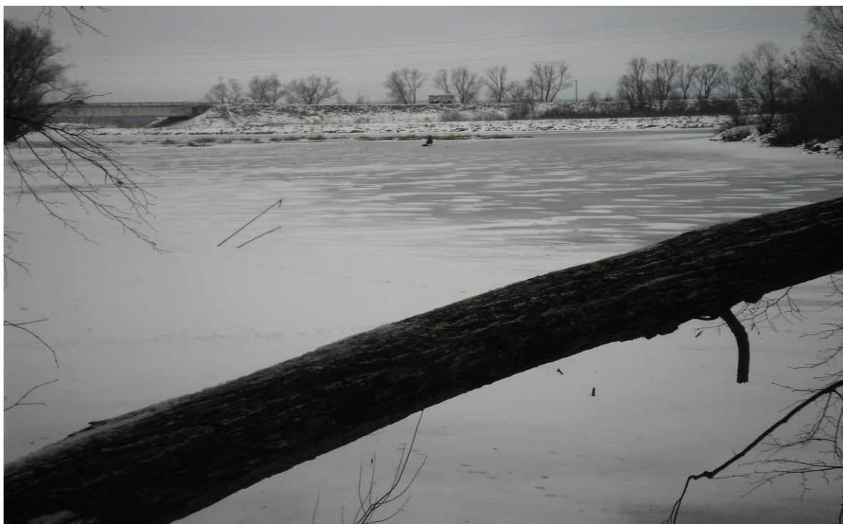
/ Мост через Кокшагу./