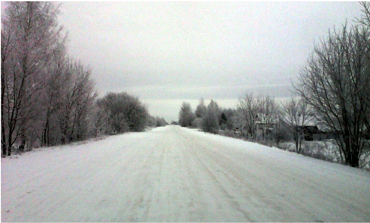
/Эх, дорога./