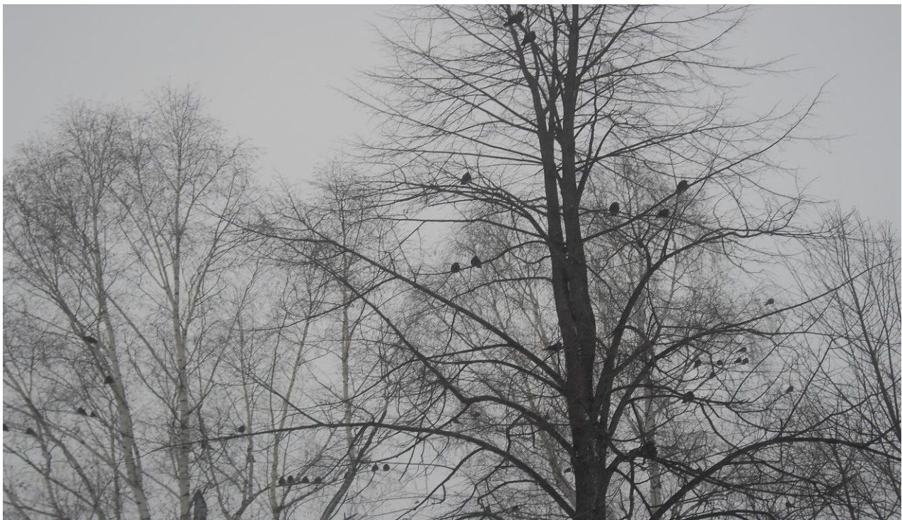
Предчувствие весны...