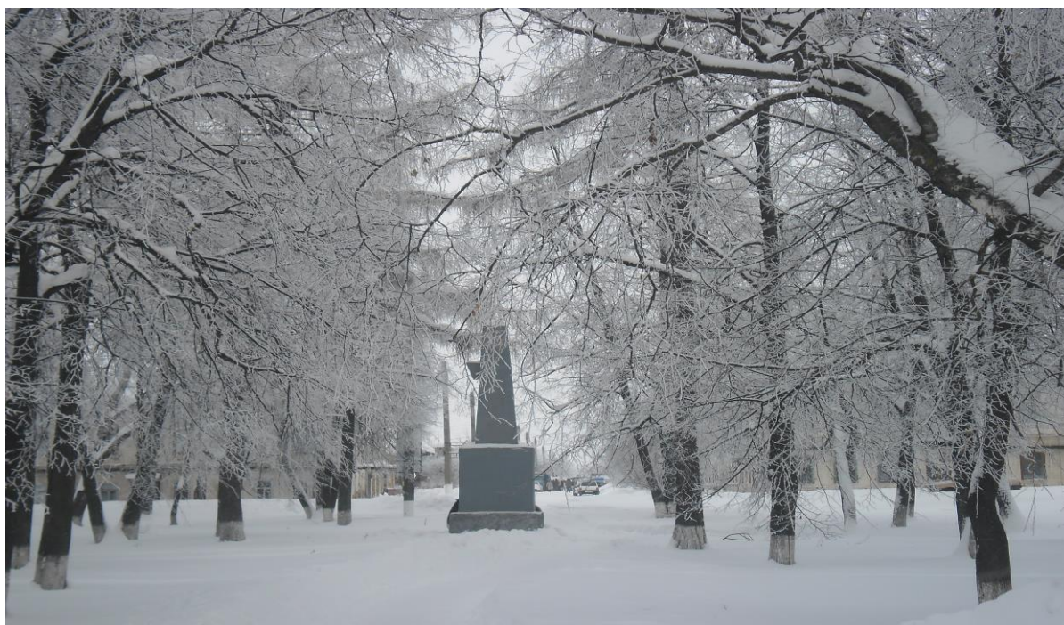
/Заснеженный парк./