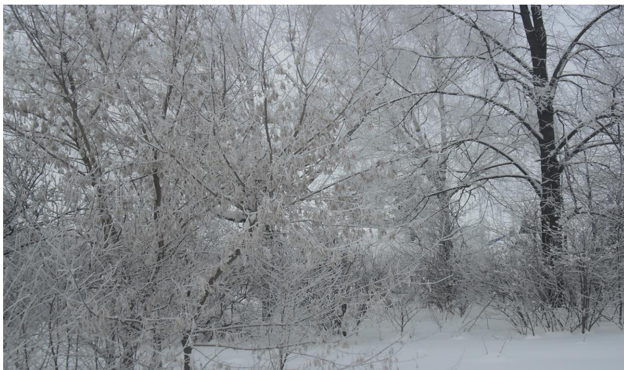
/Как в сказке./

«Природа — вечно изменчивое облако; никогда не оставаясь одной и той же, она всегда остается сама собой»