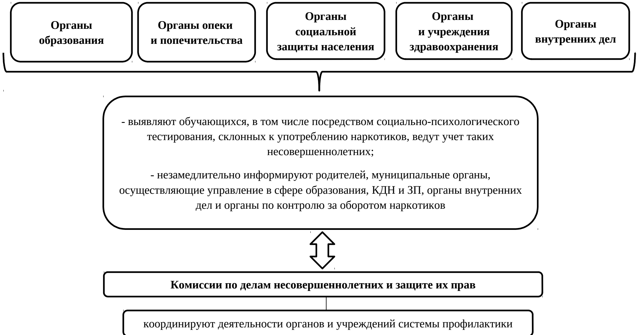
Схема 1. Выявление несовершеннолетних, употребляющих психоактивные и наркотические вещества, субъектами системы профилактики